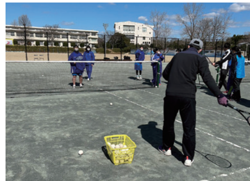
ソフトテニス教室の様子