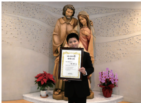
表彰状授与の様子

2022年度は4,498作品の応募をいただき、感動大賞や東邦ガス100周年記念特別賞など計109作品を表彰しました。