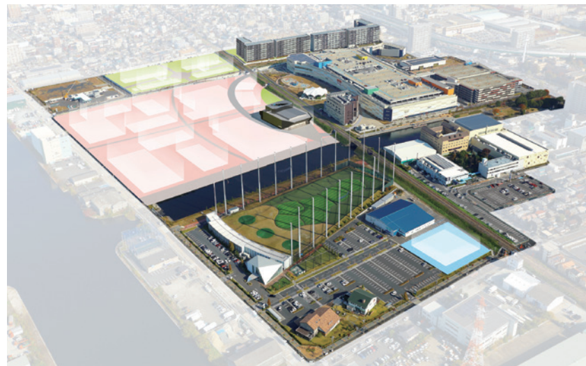
みなとアクルスの全景

*ZEH-M Orientedとは、共用部を含む建物全体で、一次エネルギー消費量を20%以上削減したマンション