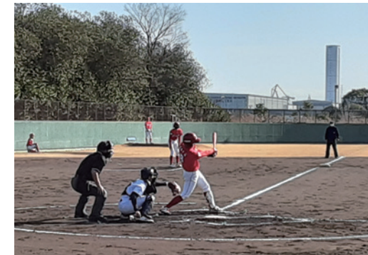
少年野球大会の様子

地域のスポーツ振興と中学生の皆さんの健全な育成に貢献するため、日本少年野球連盟(ボーイズリーグ)とともに1993年度から少年野球大会を開催しています。2022年度は29チームが参加し、熱戦が繰り広げられました。