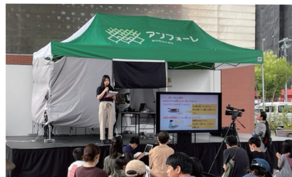
安城市主催の環境啓発イベントでのステージ出展(包括連携協定に基づく取り組み)