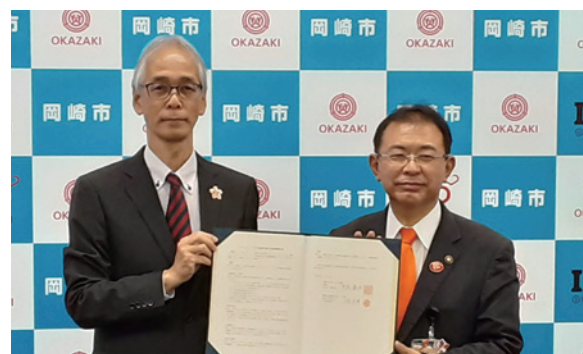
岡崎市との包括連携協定締結