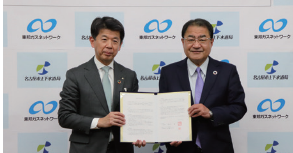
協定締結式の様子(2023年3月)

としています。今後もガス設備の維持管理や緊急対応等の保安対策を進めるとともに、関係機関との連携を一層強化し、引き続きお客さまに安全・安心な都市ガスをご利用いただけるよう努めていきます。