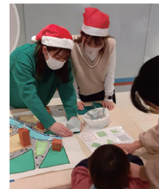
地域の大学と共同で開催したエコ教室の様子

また、「エコ教室」を毎月開催し、ビオトープの生き物観察や、リサイクル材料を利用したアート作品制作のほか、地域の大学と共同で生態系保全をクイズ形式で学ぶ教室などを実施しました。