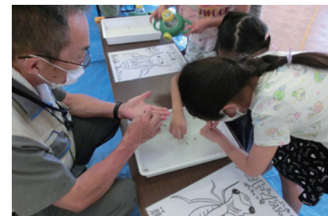
環境教育講座の様子

「展示館での見学・学習」の講座を計12回開催し、343人の小学生に参加いただきました。