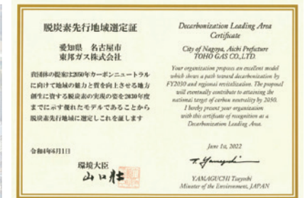
脱炭素先行地域選定証